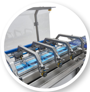
Optioneel leverbaar met separatiestation